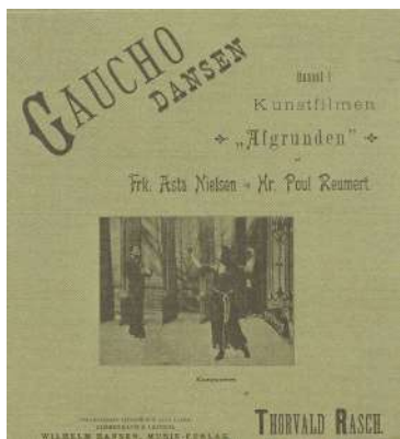
Announce for "Afgrunden"

Han var også manden bag den første længere film, den ca. 700 meter lange "Hvid slavehandel" fra 1908, der spillede næsten en halv time og derfor gav mulighed for at folde et historieforbud ud. Ole Olsen tjente rigtig mange penge, Nordisk Film havde i 1912/13 et nettooverskud på 1,8 million og var i nogle år verdens næststørste filmproducent.