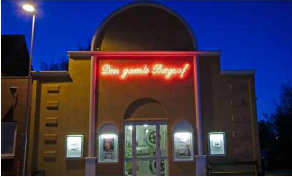
Facaden som den ser ud i 2016