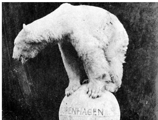
Ole Olsen får en isbjørn til at balancere på en "jordklode", og Nordisk Films logo er skabt!

I Danmark var vi godt med. Markedsgøgleren og filmmanden Ole Olsen havde oprettet Danmarks 2. biograf, Biografteatret, i Vimmelskaftet i København, men savnede som andre film at vise. Derfor købte han et kolonihaveareal i Valby i 1906 og startede her en mere systematisk filmproduktion. Ret hurtigt fik han opført et filmstudie, Nordisk Film, formentlig verdens første.