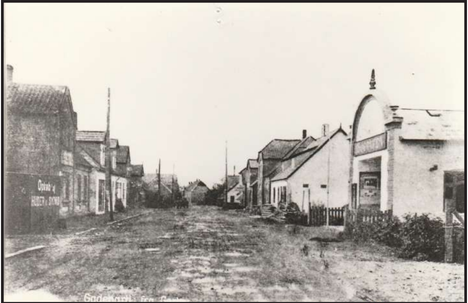
Fotografi af Østerled med Cilius Petersens ny biografbygning ca. 1916