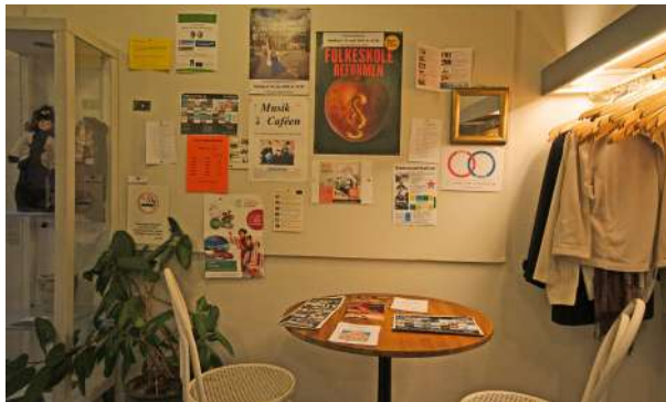
Forhallen med husets opslagstavle