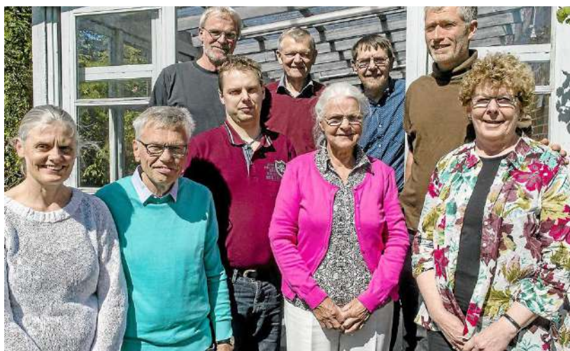
Gørlev Filmklubs nuværende bestyrelse med hjælpere: