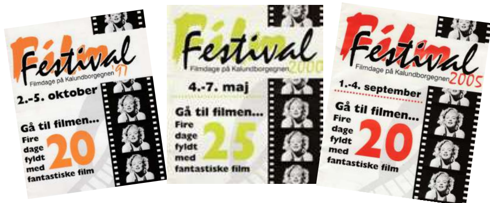
De flotte festivalprogrammer fra de 3 "Filmdage på Kalundborgegnen" i 1997, 2000 og 2005