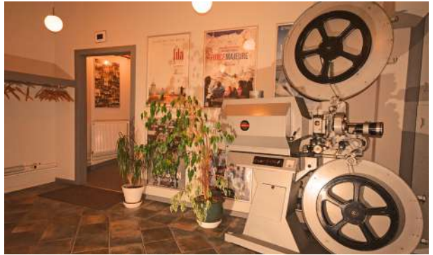
Forhallen 2016 med den gamle filmmaskine