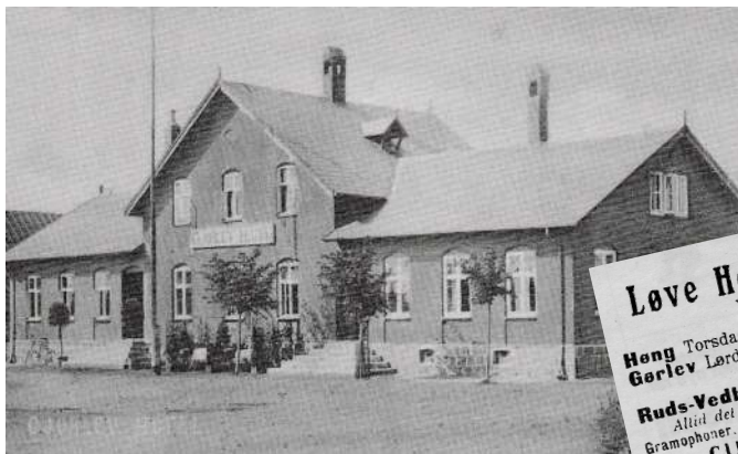
I Gørlev blev filmapparatet sat op i salen på det nu nedrevne Gørlev Hotel.

Hvornår der første gang blev vist film i Gørlev er usikkert. De første biografteater blev bygget i købstæderne allerede i nullerne. I Vestsjælland har vi f.eks. en biograf i Korsør allerede i 1907, som stadig eksisterer, efter sigende som verdens ældste fungerende biograf. Men ”ude i provinserne” så man også tidligt film, det foregik blot i forskellige lejede lokaler, hvortil filmforevisnings-apparatet blev transporteret på hestevogn.