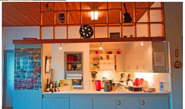
Den gamle loge blev til vores køkken/butik