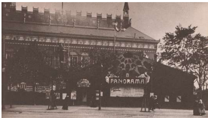
Første filmforevisning i Danmark 1896 i en midlertidig træpavillon på Rådhuspladsen i København.

Filmens fødsel dateres traditionelt til den 28.12.1895. På denne dato gennemførte brødrene Lumière i Paris den første offentlige filmforevisning. Der var tale om 10 ganske små film af ca. et minuts varighed hver, bl.a. fremstillende arbejdere, der forlader en fabrik ved fyraften, og den berømte scene med et tog, der kører ind på en station, der fik folk på de første rækker til at løbe skrigende ud! I Danmark vistes film første gang offentligt allerede den 7.6. 1896 i en pavillon på Rådhuspladsen i Køben-