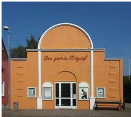
Det endelige resultat !

Herefter mødte brugere af huset op og "filsede" hele den nye facade, en slags tynd pudsning hvor farvestoffet er i cementblandingen. Brugerrådet var blevet enige om farven, en flot "gammeldags jordfarve", som skifter farve efter lys og vejr. Der blev også penge til de sidste småting, lys i udhængsskabene og neonskilt med husets navn. Indvielsen af facaden og den helt nyistandsatte forhal løb af stabelen den 9. 2. 2000. Vi var/er meget tilfredse med resultatet.