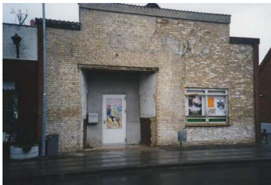
På dette billede af den "nøgne" væg ses tydeligt i murstenene, hvor stor en udvidelse af biografen der var tale om i 1942.