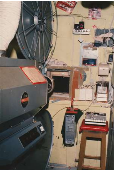
“Gørlev Kino” inde og ude ved kommunens overtagelsen i 1987.