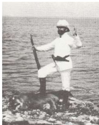
Fra Ole Olsens berømte film "Løvejagten".

Han var også manden bag den første længere film, den ca. 700 meter lange "Hvid slavehandel" fra 1908, der spillede næsten en halv time og derfor gav mulighed for at folde et historieforbud ud. Ole Olsen tjente rigtig mange penge, Nordisk Film havde i 1912/13 et nettooverskud på 1,8 million og var i nogle år verdens næststørste filmproducent.