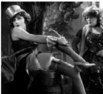
"Den blå Engel", første "Tone- og Talefilm" i Gørlev 1932 med bl.a. Marlene Dietrich