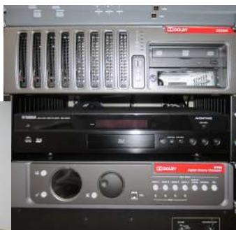
Dele af det nye digitaleudstyr